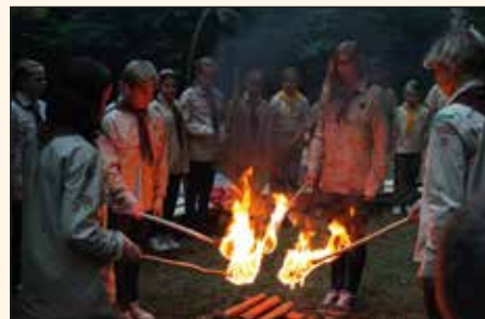
skautského roku! Na všechny naše světlušky, vlčata, skauty i skautky už se moc těšíme!

No, na táboře jsme toho zažili ještě spoustu, což jste mohli vidět na promítání fotek a posezení „Vzpomínáme na tábor“, které se konalo 3. 9. Ale teď už dost se vzpomínáním, je čas se vrhnout do dalšího